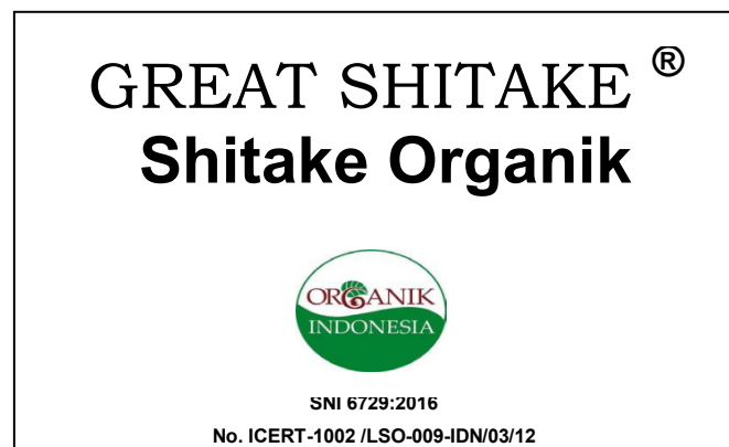
Gambar 3. Contoh pencantuman label Tanda Organik pada kemasan produk pangan organik pic 3. The example of inclusion Organic label on the package of organic food