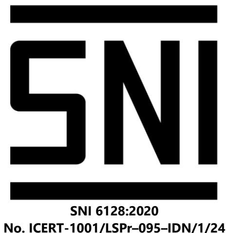
Gambar 2. Contoh pencantuman logo SNI pada kemasan produk tersertifikasi SNI produk. Figure 2. The example of SNI logo inclusion on the SNI product certified product packaging