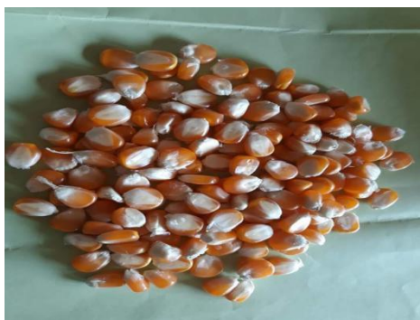
Gambar A.1 - Biji normal pipil kering