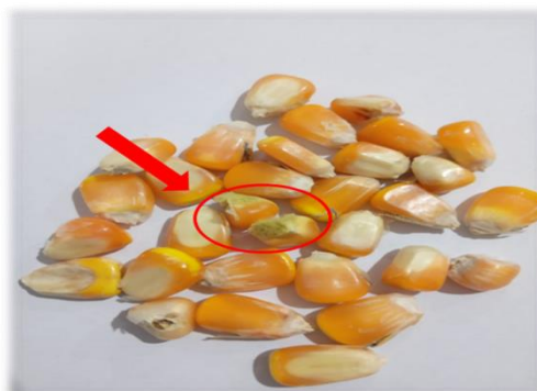
Gambar A.3 - Biji berjamur