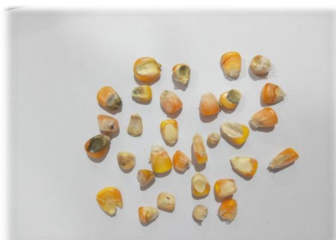
Gambar A.2 - Biji rusak