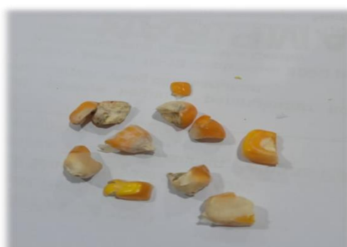
Gambar A.4 - Biji pecah